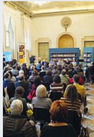
Il foyer del teatro Comunale ieri