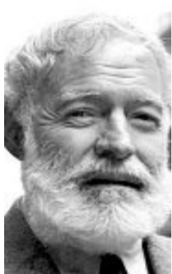
Ernest Hemingway. A destra un'immagine di Villa Favorita a San Pietro di Ozzano